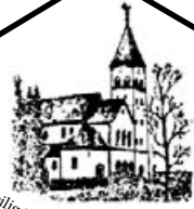
Heilig Hart van Jezus Haanrade

PAROCHIEBLAD 50 e jaargang nr. 11 - NOVEMBER 2025