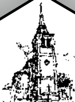
H. Lambertus Centrum