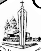
St. Petrus-Maria t.h.o. Chevremont