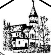
Heilig Hart van Jezus Haanrade

PAROCHIEBLAD 50 e jaargang nr. 6 - JUNI 2025