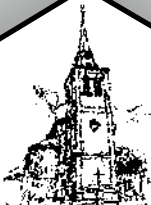
St. Lambertus Centrum