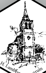
H. Lambertus Centrum