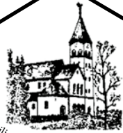
Heilig Hart van Jezus Haanrade

PAROCHIEBLAD 49 e jaargang nr. 11 - november 2024