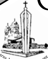
St. Petrus-Maria t.h.o. Chèvremont