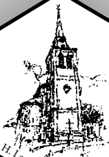
H. Lambertus Centrum