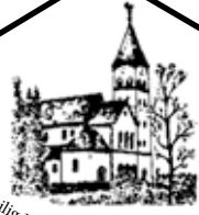
Heilig Hart van Jezus Haarnrade

PAROCHIEBLAD 48 e jaargang nr. 03 maart 2023